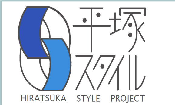
※ SFCチーム考案の平塚スタイル公式ロゴマーク

プロジェクトのポータルサイトを作ることで、商工会議所青年部と大学生による平塚の魅力の再発見のプロセスを「みえる化・アーカイブ化」し、地域と大学の連携と平塚の「活性化」が継続していくプラットフォームの構築を目指します。